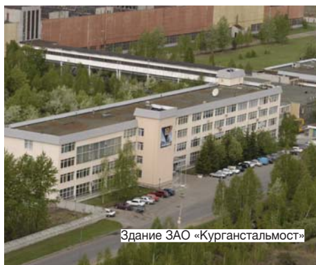
Здание ЗАО «Курганстальмост»

«СЕГОДНЯ В ЛЕЙПЦИГЕ ОТКРЫТ ДЛЯ ДВИЖЕНИЯ МОСТ, СОЗДАННЫЙ ИЗ МЕТАЛЛОКОНСТРУКЦИЙ ЗАО "КУРГАНСТАЛЬМОСТ" (ТОЧНЕЕ, МОСТЫ-БЛИЗНЕЦЫ, КАЖДЫЙ ПО 60 М В ДЛИНУ И 17 М В ШИРИНУ, 730 Т МЕТАЛЛОКОНСТРУКЦИЙ)»