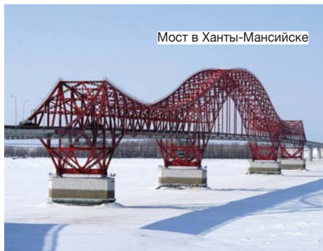
Мост в Ханты-Мансийске

— У вашей компании романтический запоминающийся девиз: «Соединяя берега, мы обретаем мир единый». Вы не преувеличиваете значение мостостроения в устройстве мира?