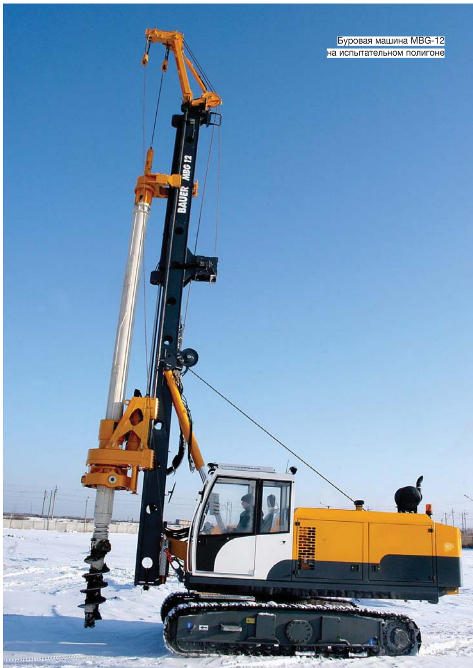
Буровая машина MBG-12 на испытательном полигоне

«ЗАО "КУРГАНСТАЛЬМОСТ" БЫЛО ПРИЗНАНО МИНИСТЕРСТВОМ ЭКОНОМИЧЕСКОГО РАЗВИТИЯ И ТОРГОВЛИ РОССИИ "САМЫМ ДИНАМИЧНО РАЗВИВАЮЩИМСЯ РОССИЙСКИМ ЭКСПОРТЕРОМ"»